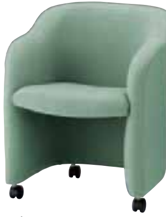
ラネス C ¥66,885 (63,700) 張材 / 布地・D-20(ライトグリーン) LO 6094