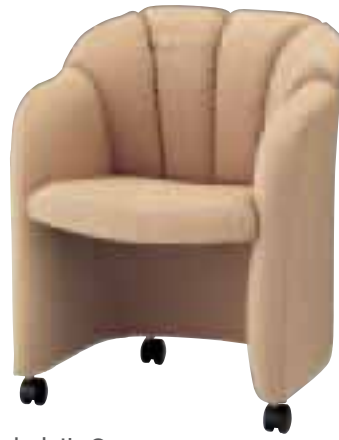
セネル C ¥64,680 (61,600) 張材 / 布地・B-95(ベージュ) LO 6093