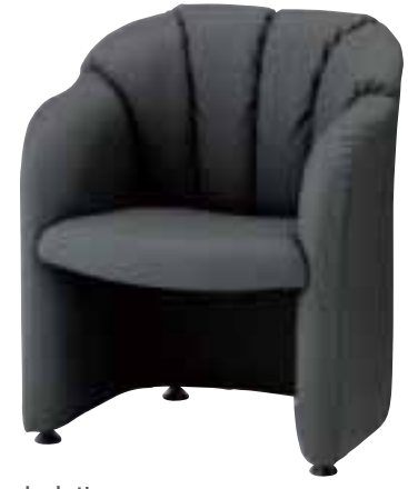
セネル ¥61,320 (58,400) 張材 / レザー・B-27(No.8) LO 6092