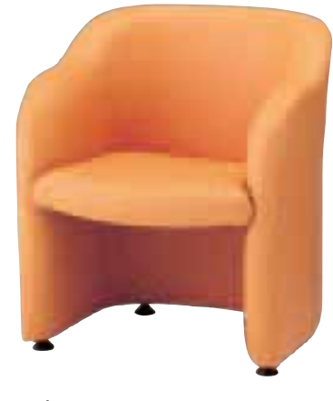
ラネス ¥57,750 (55,000) 張材 / レザー・B-08(No.79) LO 6091