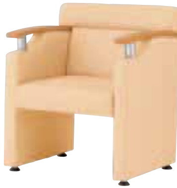
アペルト ¥78,540 (74,800) 張材 / レザー・B-04(No.72) LO 6032