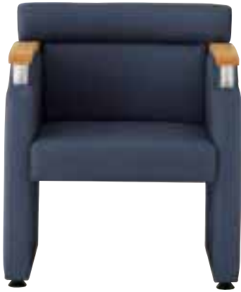
アペルト ¥78,540 (74,800) 張材 / レザー・B-27(No.18) LO 6032