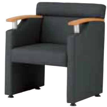
アペルト ¥78,540 (74,800) 張材 / レザー・B-27(No.8) LO 6032