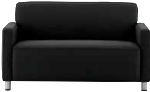
サパー ¥93,030 (88,600) 張材 / 布地・C-97 (ブラック) SO 3630