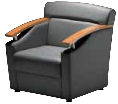
アウラ M ¥99,330 (94,600) 張材 / レザー・C-22(No.48) IO 6031