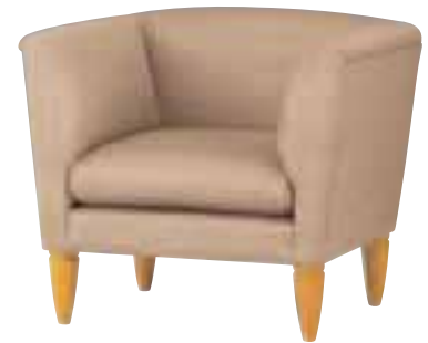
アドール M ¥101,535 (96,700) 張材 / 布地・D-80(ライトブラウン) WO 5111