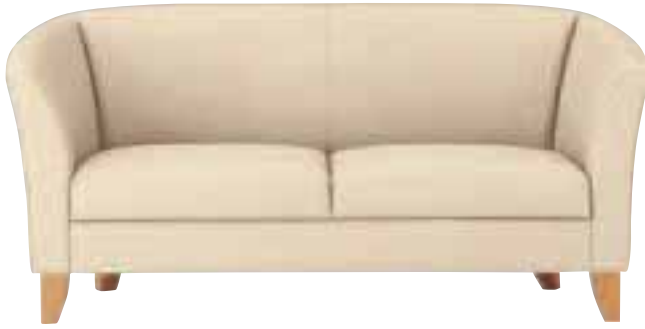
アービン N ¥159,810 (152,200) 張材 / レザー・A-10 (No.41) WO 4000