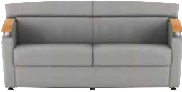
アウラ N ¥154,770 (147,400) 張材 / レザー・B-04(No.79) IO 6030