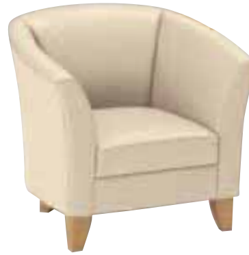
アービン M ¥101,955 (97,100) 張材 / レザー・A-10(No.41) WO 4001