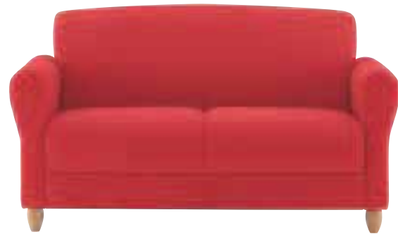
ルータム ¥98,385 (93,700) 張材 / 布地・C-97 (レッド) SO 3640