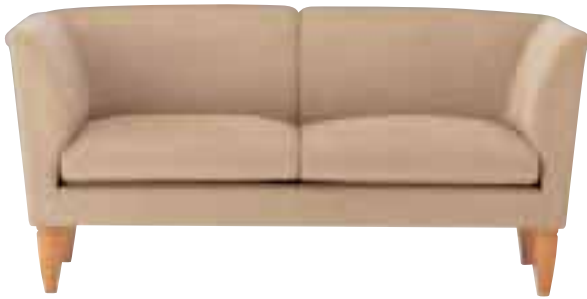
アドール N ¥158,655 (151,100) 張材 / 布地・D-80(ライトブラウン) WO 5110